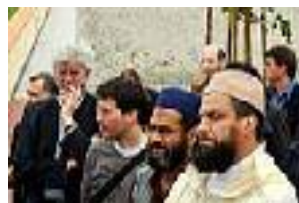
Muslime in der Schweiz

Muslime werden im Alltagsleben diskriminiert. Deshalb gibt die Eidg. Kommission gegen Rassismus (EKR) Empfehlungen ab, wie Ungleichbehandlungen wegen der Religionszugehörigkeit ausgemerzt und Vorurteile abgebaut werden können.